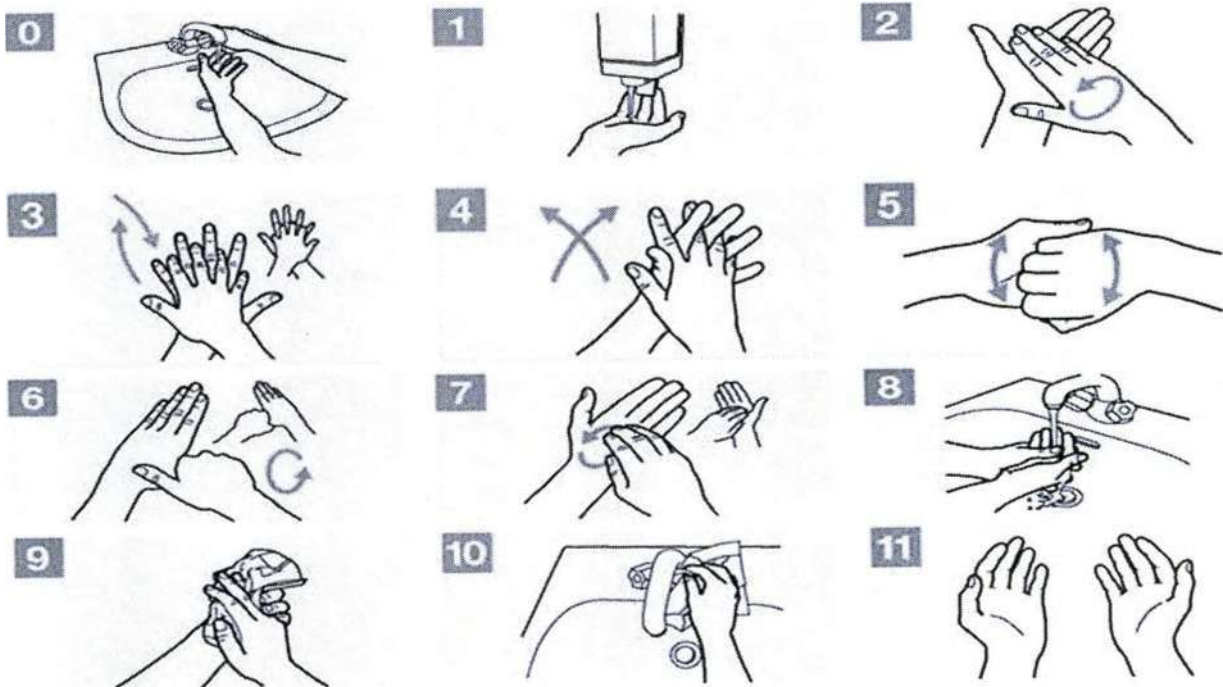
Рис. 11 – Процедура закончена

Рис.10 - Использовать полотенце для закрытия крана